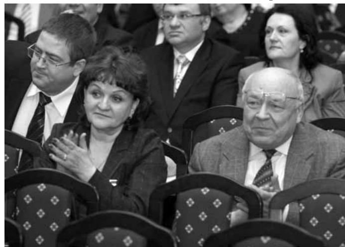
Фото Сергея УНРУ ●