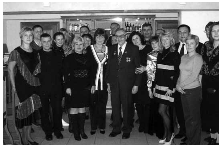
Адвокатская консультация № 33 «Исаакиевская»